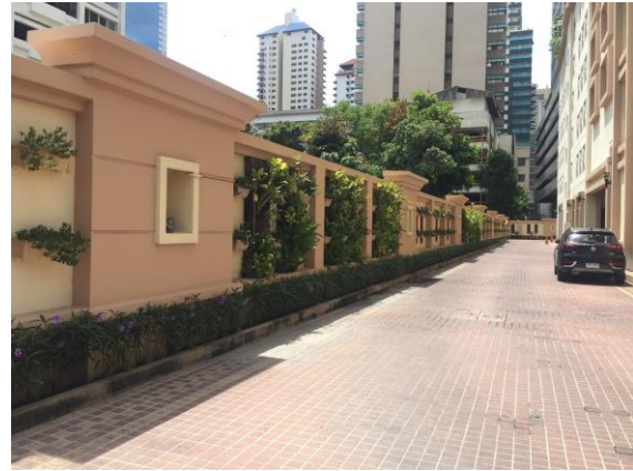
พื้นที่สีเขียวบริเวณชั้นล่าง