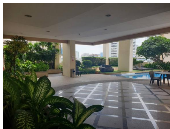
พื้นที่สีเขียวบนอาคาร

รูปที่ 2.5-1 สภาพพื้นที่สีเขียวบริเวณชั้นล่าง และพื้นที่สีเขียวบนอาคารโครงการ